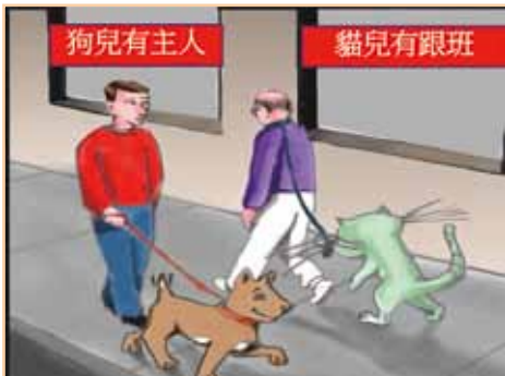
▲貓心態和狗心態的差異

教會所生的病，病名就是「人本主義」，認為人生的目的是追求快樂，這種論調在今天的世界及大學裡廣為流傳，並且也悄悄地傳入了教會。在「榮光大顯」講座中稱這病為「貓的心態」或「貓的神學」，這是一種隱喻。若拿貓與狗相比，貓兒對主人的態度比狗兒冷漠、不聽命令、又比較依賴主人的供應，因此我們無法訓練貓兒成為「導盲貓」。聖經提摩太後書三章1-2節稱這病為「專愛自己」。聖經說：在末世時，世人就會變成這種景況。