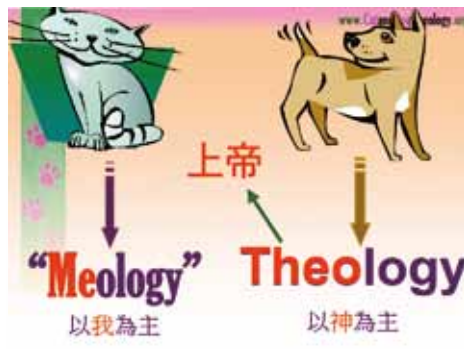
▲正確的心態——以神為主

基督受死及救贖的主角。如果這是我們唯一的答案，那我們就將基督之死侷限在人能得到什麼好處罷了（以人為主）。若再問「耶穌的死，父神得到什麼？」，大多數的答案是「得到我們」，這仍然是把耶穌的死當作「只有」為「人」死罷了，很少人知道：天父上帝從耶穌的死得到「榮耀、尊榮、頌讚、敬拜、順服」。