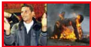
▲ 第一根火柴 燒出大問題

「一元化」的傳統反映在宗教上是宗教歧視，主政者往往放任非「正信」者受逼迫，讓他們淪為社會中的次等公民。