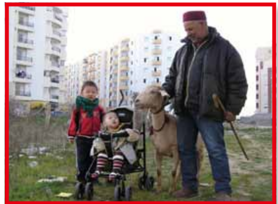
▲新舊交替，何去何從？

闊別多年，對突尼斯的發展印象深刻。近年來，國家大興土木，都市不斷發展，新社區比比皆是。消費市場更非同日而語，不少餐廳和商店的消費跟歐洲相去不遠。馬路上變得車水馬龍，汽車增長速度為十年前的五倍，走在路上，經常看見高級跑車疾駛而過。