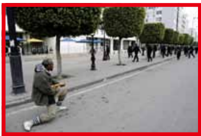
▲ 手中小小麵包 引發大大革命

商品市場經濟比較不干涉市場運作。人口增加，商品需求加大，導致物價上升。加上非自然因素，如商人聯手提高售價，以賺取更多利潤，造成百姓生活百上加斤。