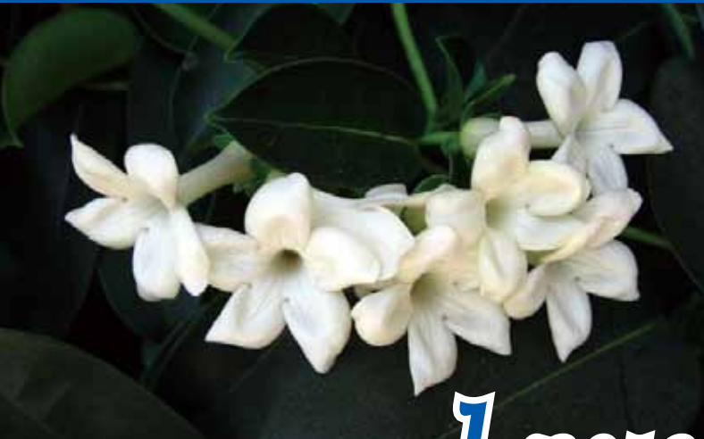
▲悠悠花香吐露幽怨民心